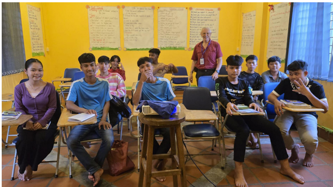
Les élèves en cours

Par Claudie Pion Pellet - Édition Marie-Christine Sudre